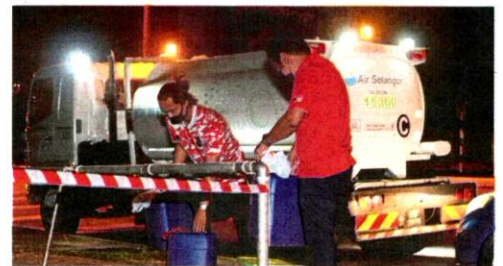
People collecting water supplied by Air Selangor from water pipes in Subang Jaya on Thursday, following the water supply disruption due to odour pollution at the Sungai Semenyih Water Treatment Plant.

State Tourism, Environment, Green Technology and Orang Asli Affairs Committee chairman Hee