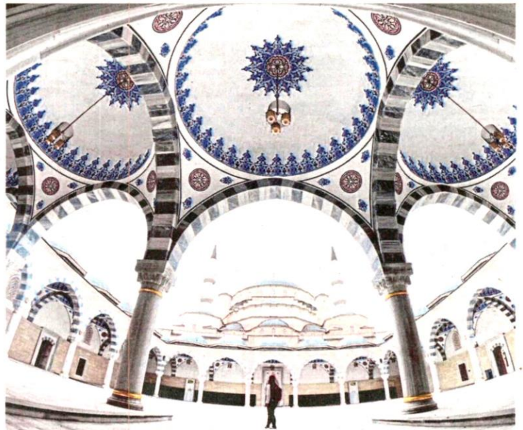
SETIAP individu Muslim harus menjaga tutur kata yang boleh menggugurkan iman.

Namun begitu, dia perlu lebih berhati-hati untuk tidak lagi mengulanginya. Kesilapan mirip seperti ini pernah disebutkan oleh Nabi SAW dalam sebuah hadis baginda sabdanya: "Sungguh kegembiraan Allah kerana taubat hamba-Nya melebihi kegembiraan salah seorang daripada kalian terhadap binatang tunggangannya di sebuah padang pasir yang luas, namun tiba-tiba binatang tersebut lepas. Sedangkan di atasnya ada bekal makanan dan minumannya sehingga akhirnya dia berasa putus asa untuk mencari. Kemudian dia beristirehat di bawah sebatang pohon dalam keadaan putus asa untuk menemuinya kembali. Sewaktu dalam keadaan itu, tiba-tiba dia mendapati binatang tunggangannya sudah ada berdiri