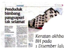
Keratan akhbar BH pada 1 Disember lalu.

"Pangsapuri terbabit berusia lebih 20 tahun, terdiri daripada