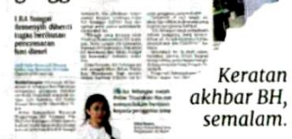
Keratan akhbar BH, semalam.