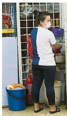
供水中断，一些居民或餐饮业者被迫把已使用的碗碟餐具堆放在一旁，等水供恢复才作清洗。