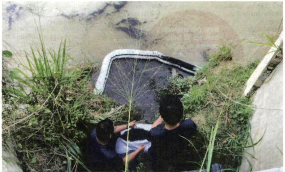
PETUGAS Luas memasang 'oil boom' dan serbuk karbon teraktif bagi mengelakkan sisa minyak terus mengalir ke Sungai Semenyih.

"Inisiatif pencegahan dipertingkatkan dengan meletakkan empat beg serbuk