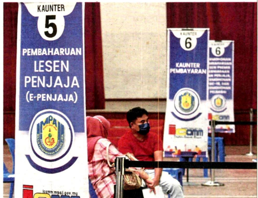
Prospective traders can head to Dewan Dato Ahmad Razali in Ampang Jaya to apply for the temporary business licence.

MPAJ extends temporary business licence initiative by legalising 518 roadside hawkers