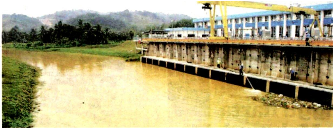
LRA Sungai Semenyih di Jenderam Hilir, Sepang, Selangor dihenti tugas selepas dikesan berlakunya pencemaran di Sungai Semenyih kelmarin.

Polis siasat kes pencemaran di Sungai Semenyih