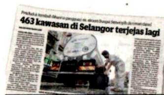
KERATAN Kosmo! semalam.

"Lima sampel air di laluan seperti yang dinyatakan pengadu dan di muka sawk LRA diambil oleh Polis Selangor termasuk di dalam premis kilang yang disya-