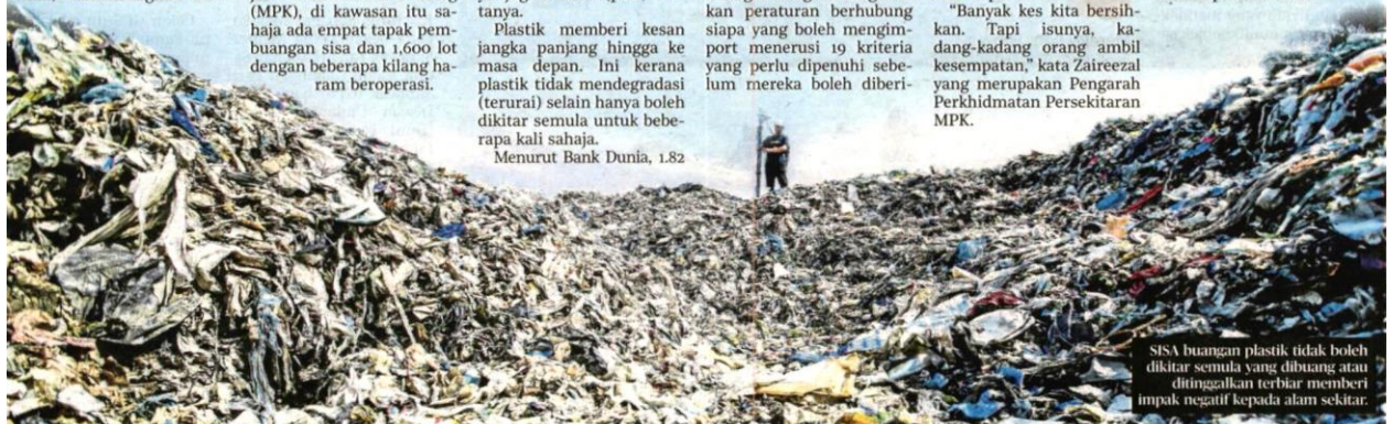
SISA buangan plastik tidak boleh dikitar semula yang dibuang atau ditinggalkan terbiar memberi impak negatif kepada alam sekitar.

Apa juga haluan yang diambil negara pada masa depan, paling penting ialah mengambil kira kesan plastik terhadap semua aspek kehidupan manusia.