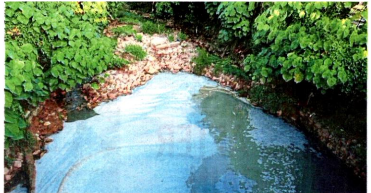
Traces of foam seen on the surface of Sungai Rinching, a tributary of Sungai Semenyih, on Thursday.

Investigations led to discovery of an underground stream believed to produce 'oil-like' waste