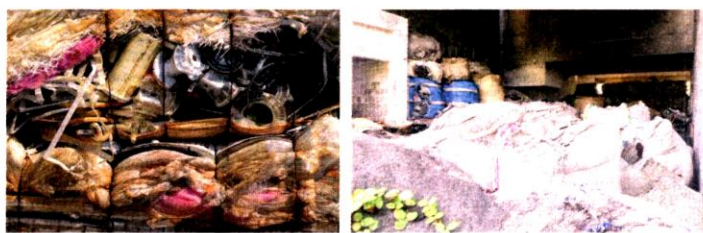
Antara longgokan bendela sisa buangan plastik import di kawasan perindustrian Pulau Indah, Klang, Selangor.