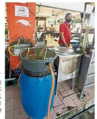
一些商贩受供水中断影响，选择休息一日。